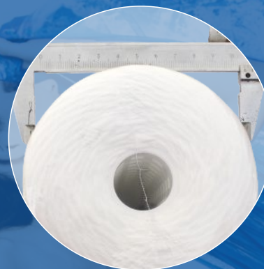
Wkład 20" x 4 1/2" Średnica: 107 mm Waga: 1,820 kg

W chwili obecnej „najgrubsze” i „najcięższe” wkłady dostępne na rynku! Dołącz do najlepszych i włącz do oferty produkty serii S-PS PREMIUM LINE!