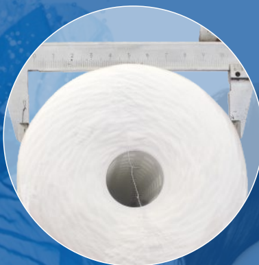
Wkład 9 7/8" x 4 1/2" Średnica: 107 mm Waga: 0,940 kg